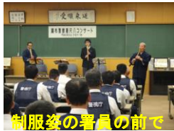
制服姿の署員の前で

会場の講堂には八十数名の制服姿のお巡りさんが集まり、尺八の演奏を聴いていただきましたが、演奏予定の高校生が途中で道に迷い、私が搜索願を出す直前にお巡りさんが案内してくれるという場面もありました。 また、尺八吹奏体験も行い署長さん他約30人の署員の方がチャレンジしました。何と七割の方が