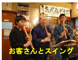
お客さんとスイング

三月三十一日お食事処「浜勝」を会場にささやかな第二回忘れまいぞ3.11追悼コンサートを実施しました。一〇数名の方が賛同し、キヤンドルを購入してくれました。