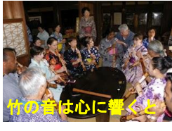
竹の音は心に響くと

音を出しました。フィナーレは会場の全員で故郷、今日の日はさようならを合唱いたしました。