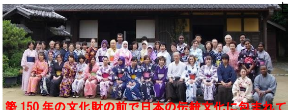
築150年の文化財の前で日本の伝統文化に包まれて

五月一九日は介護福祉士会の総会での演奏です。主催は特定非営利法人川崎市介護福祉士会。会場は溝口「スクラム2」。演奏は尺八二重奏を中心に本曲木枯、カラオケ2曲。そしてフィナーレは、福祉士会のお餅つきと故郷・今日の日はさようならの全員合唱でお開きとなりました。私達は早めに出ていましたが、総会が予想以上に早く終わったため早く来ての電話が来る程総会も演奏も、円滑に終了しました。有難うございました。