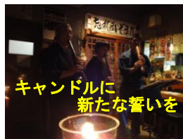
キャンドルに新たな誓いを